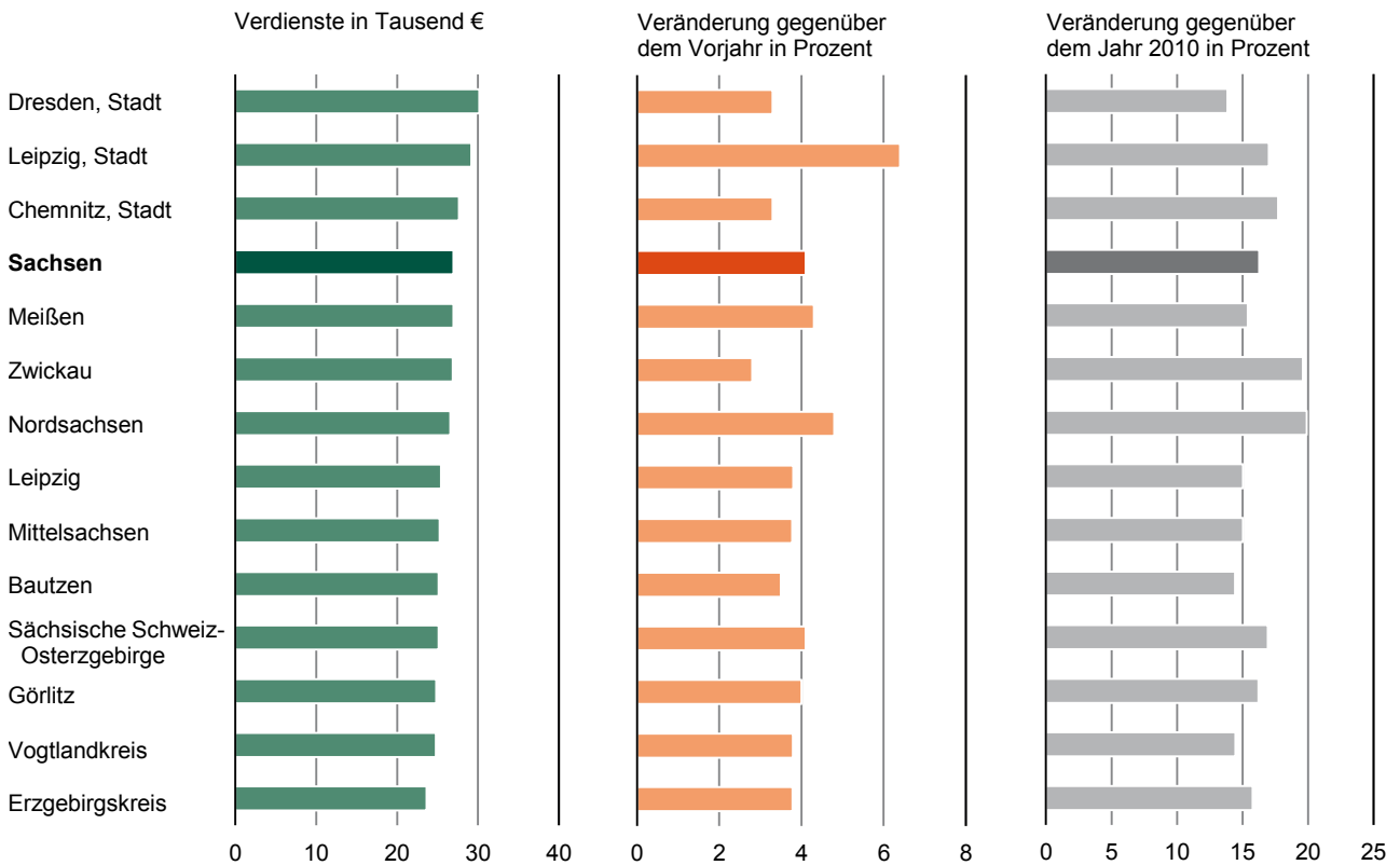
Tab. 1 Bruttolöhne und -gehälter im Freistaat Sachsen 2015 1) nach Kreisfreien Städten und Landkreisen