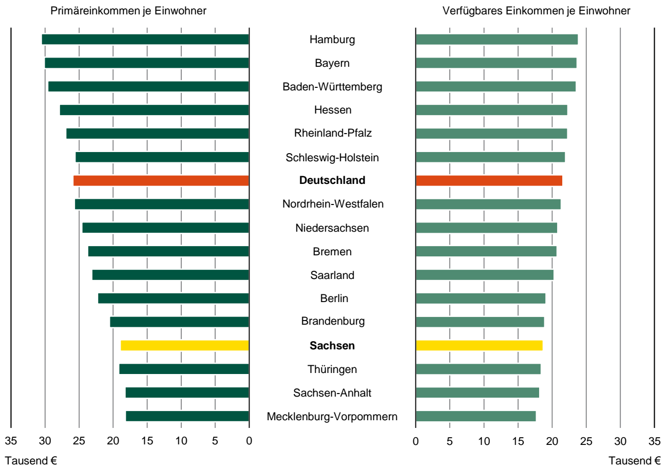
Abb. 2 Verfügbares Einkommen der privaten Haushalte 1) ab 2000 3) Veränderung gegenüber dem Vorjahr