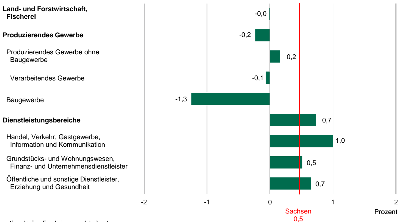
Abb. 2 Erwerbstätige 1) im Freistaat Sachsen im 1. Quartal 2023 nach Wirtschaftsbereichen 2) Veränderung gegenüber dem Vorjahr