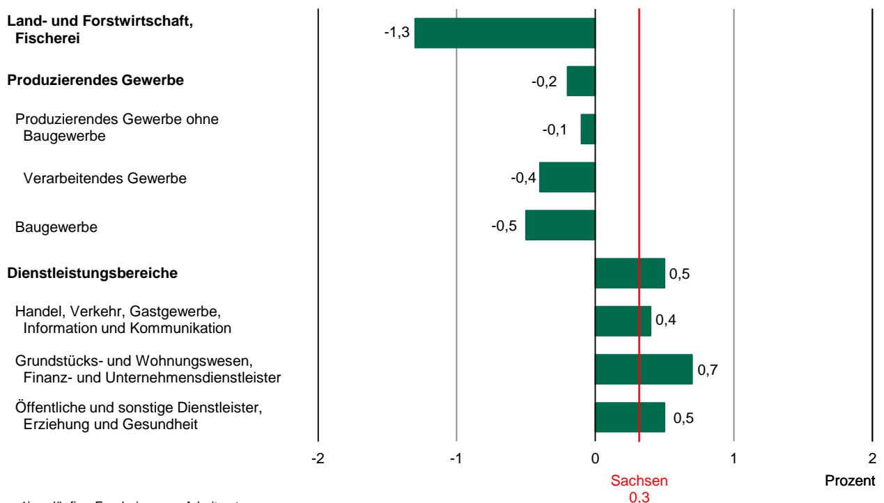
Abb. 2 Erwerbstätige 1) im Freistaat Sachsen im 3. Quartal 2023 nach Wirtschaftsbereichen 2) Veränderung gegenüber dem Vorjahr