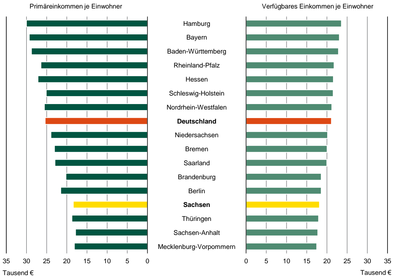
Abb. 2 Verfügbares Einkommen der privaten Haushalte 1) ab 1992 3) Veränderung gegenüber dem Vorjahr