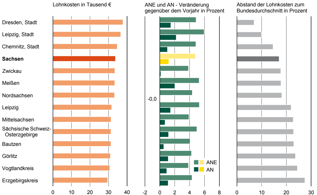
Tab. 2 Arbeitnehmerentgelt im Freistaat Sachsen 2016 1) nach Kreisfreien Städten und Landkreisen