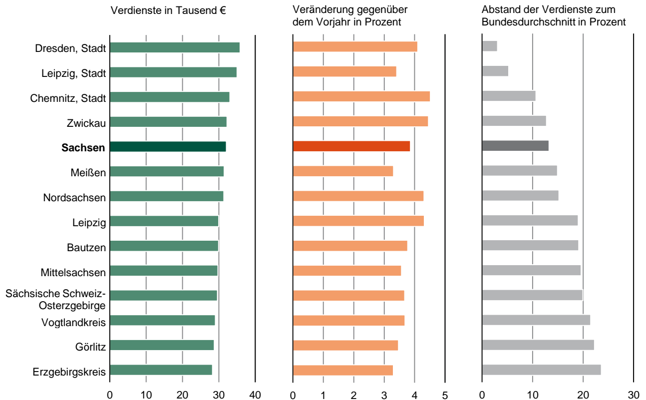
Abb. 2 Regionale Divergenzen beim Verdienstniveau in den Kreisen des Freistaates Sachsen 2019 nach Wirtschaftsbereichen 1) Bruttolöhne und -gehälter je Arbeitnehmer/-in